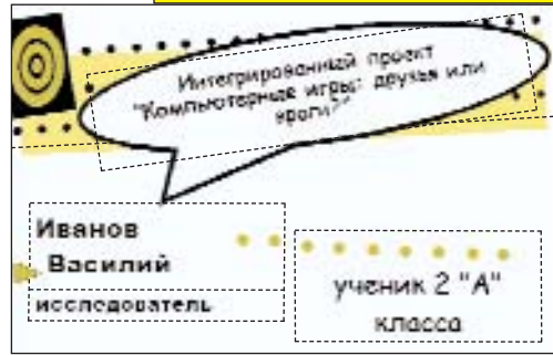
Рис. 1. Использование MS Publisher для создания визитки

Для наблюдения за деятельностью учащихся в создании интегрированных проектов учитель может создать на рабочем компьютере индивидуальные папки для каждого