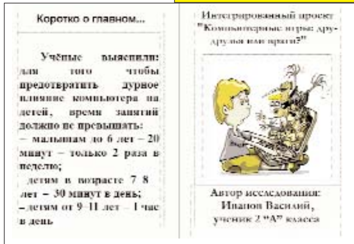
Рис. 4. Пример буклета, созданного при помощи программы MS Publisher

Таким образом, использование ИКТ не только сделает проект интересным в плане подготовки презентационных материалов, но и поможет младшим школьникам освоить средства ИКТ, повысить интерес